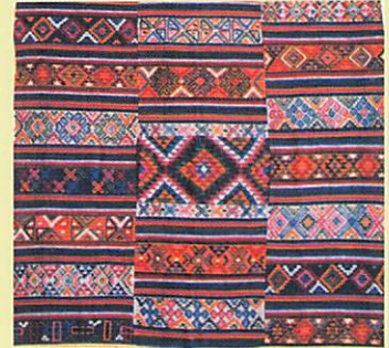
ウールのレインコート (チャカプ)