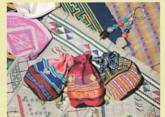
ブータン染織の冊子、手織小物の販売

★ブータン紹介のライド、ブータンのお菓子、民族衣装試着、染織講演会など(表面参照)ぜひご参加ください!