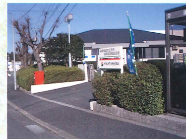
古賀市食品工業団地組合