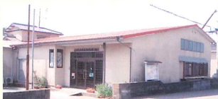
老朽化の児童館建て替え要望(米多比区)

★子ども見守り隊活動(毎日毎朝) 4年間危険な通学路での見守りや挨拶運動実施中。児童が集い、快適に学習できる居場所の確保をします。