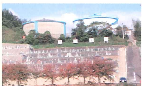
医王寺のタンクより導水計画

★小野里団地、小野小学校、薬王寺団地及び林田団地を第10期水道区域拡張要請書完成し厚生労働省と折衝