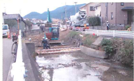
小野小学校前井堰完成