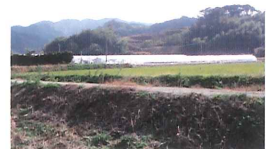
薬王寺バイパス予定地 恵内作付近