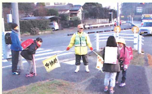
交通安全や挨拶運動指導(薬王寺交差点)